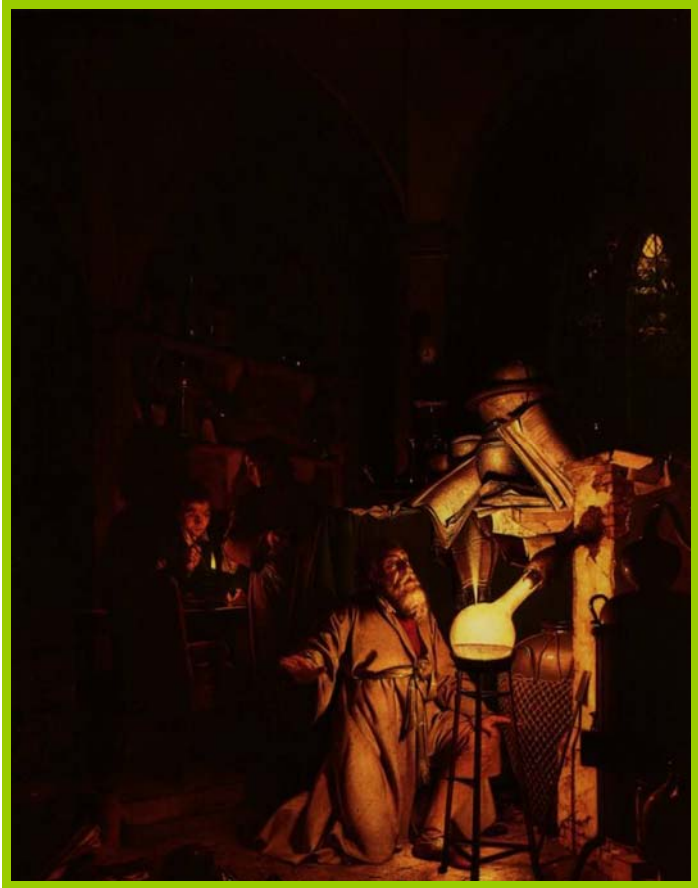
Џон Рајт од Дербија, Алхемичар